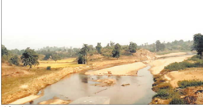
पोड़ी उपरोड़ा तान नाल।

■ पोड़ी उपरोड़ा विकास खंड में पहाड़ी नालों की संख्या ज्यादा