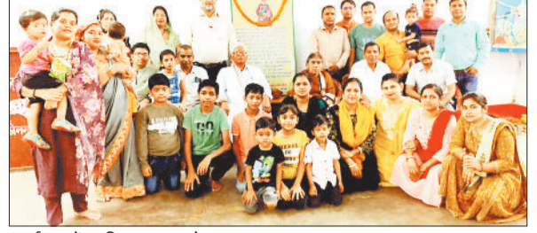
कार्यक्रम में उपस्थित समाज के सदस्य।