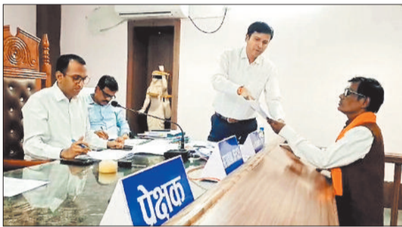
नामवापसी के दौरान उपस्थित अभ्यर्थी।

जिले में तीसरे चरण के लिए 7 मई को होने जा रहे मतदान हेतु 12 अप्रैल से नाम निर्देशन पत्र दाखिल करने की प्रक्रिया शुरू की