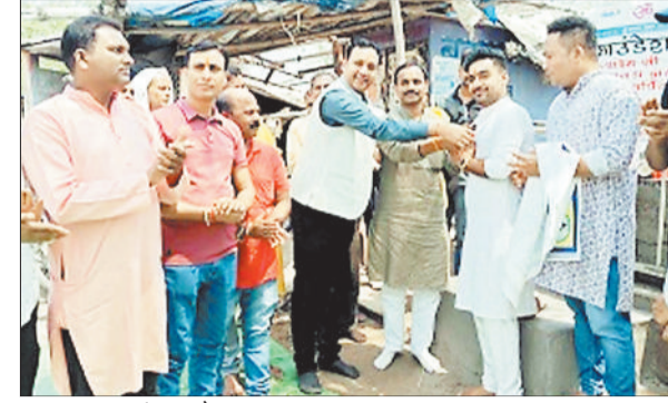
प्याऊ का शुभारंभ करते हुए।