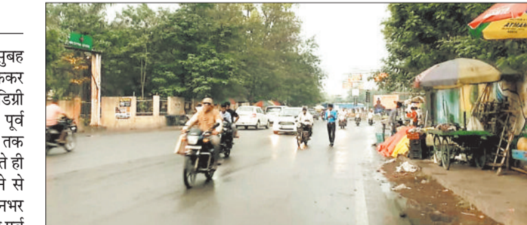
दोपहर बाद शाम को हुई बूदाबांदी से शहर भीगा।

तेज गर्मी के बीच मंगलवार की सुबह आसमान में बादल छाने और रुक रुककर बारिश होने से दिन का तापमान 37 डिग्री सेल्सियस तक पहुंच गया। एक दिन पूर्व सोमवार को दिन का तापमान 44 डिग्री तक पहुंच गया था। मौसम के करवट बदलते ही तापमान 7 डिग्री सेल्सियस नीचे आने से लोगों को गर्मी से राहत मिली। दिनभर सड़कों में चहल पहल रही जो एक दिन पूर्व सूखसान रहा करती थी।