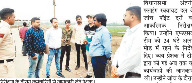
निरीक्षण के दौरान कर्मचारियों से जानकारी लेते प्रेक्षक।