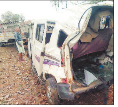
दुर्घटनाग्रस्त क्षतिग्रस्त वाहन।