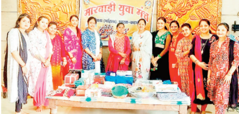
सामग्री वितरण करते हुए मंच की सदस्य।