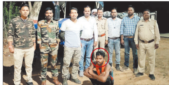
ताल घेरे में पकड़ा गया आरोपी।