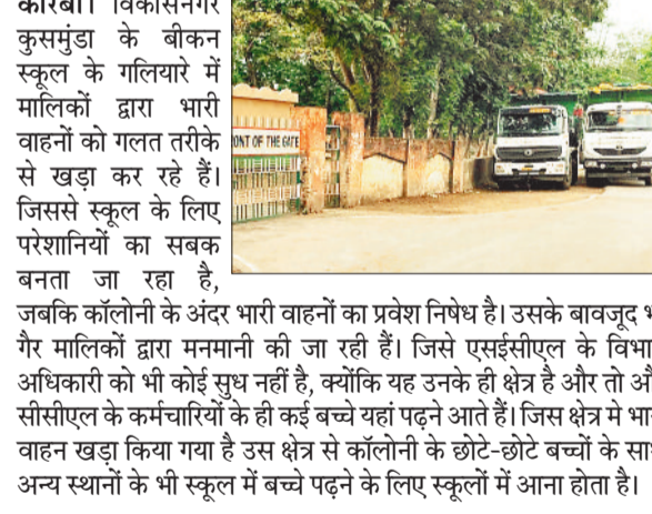
कोरबा। विकासनगर कुसमुंडा के बीकन स्कूल के गलियारों में मालिकों द्वारा भारी वाहनों को गलत तरीके से खड़ा कर रहे हैं। जिससे स्कूल के लिए परेशानियों का सबक बनता जा रहा है, जबकि कॉलोनी के अंदर भारी वाहनों का प्रवेश निषेध है। उसके बावजूद भी गैर मालिकों द्वारा मनमानी की जा रही है। जिसे एएससीएल के विभाग अधिकारी को भी कोई सुन नहीं है, क्योंकि यह उनके ही क्षेत्र है और तो और सीसीएल के कर्मचारियों के ही कई बच्चे यहां पढ़ने आते हैं। जिस क्षेत्र में भारी वाहन खड़ा किया गया है उस क्षेत्र से कॉलोनी के छोटे-छोटे बच्चों के साथ अन्य स्थानों के भी स्कूल में बच्चे पढ़ने के लिए स्कूलों में आना होता है।